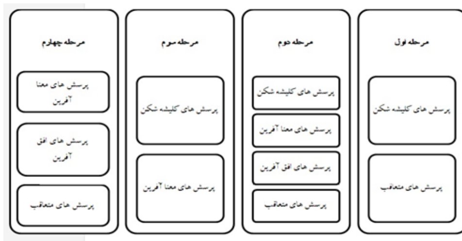
شکل ۲: رابطه مراحل فهم با هر یک از انواع پرسش